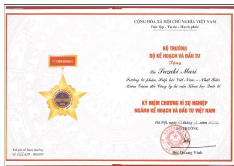
記念章授与証明書